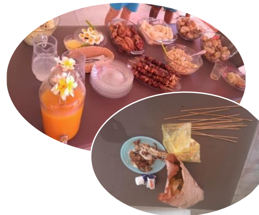
Au menu du pique-nique zéro déchet SERD 2021.