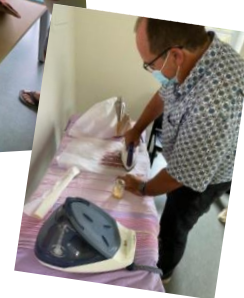
Atelier bee Wraps au Mont-Dore SERD 2021