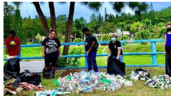
Des participants à l'atelier «ramassage des déchets » à Païta, SERD 2021.

A la demande de la commune de Païta, série d'ateliers visant à permettre aux habitants du quartier des Scheffléras de réinvestir leur espace en y donnant du sens : - revalorisation des palettes en jardinières et cendriers, pour utiliser des ressources facilement accessibles, partager un savoir-faire, améliorer le lieu de vie et aider les fumeurs à se débarrasser de leurs mégots. - ramassage, analyse et tri des déchets autour de la maison de quartier, en sensibilisant à l'impact des déchets sur l'environnement et notre santé. - compostage, fabrication d'instruments de musique, de cendrier de poche et de sacs à partir de divers déchets, pour offrir un savoir-faire et réfléchir aux différentes possibles deuxième vie de nos déchets, dont l'enrichissement des sols et jardinières du quartier, fraîchement revégétalisés avec des espèces endémiques.