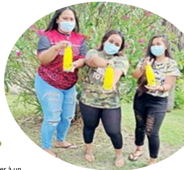
Des élèves du lycée Dick Ukeiwë, à la remise des gourdes, SERD 2021

87% des 52 élèves répondants souhaitent participer à un évènement lié au développement durable en 2022