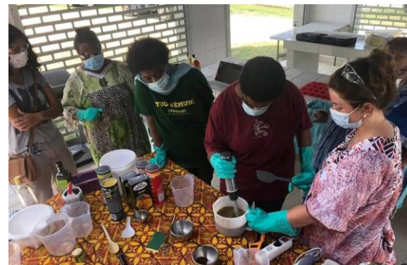
Des participantes à l'atelier « cosmétiques maison » Touho, SERD 2021.