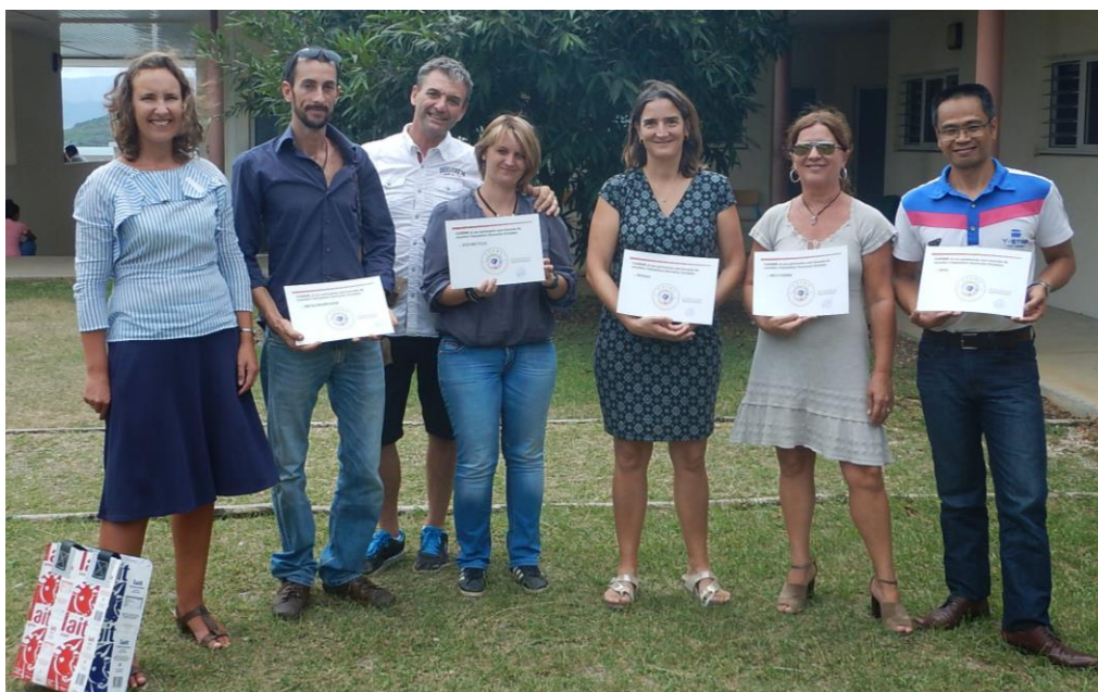
Figure 2 : Remise des labels Economie Circulaire 2016.

Les lauréats du label bénéficieront d'une labellisation « économie circulaire » de leur initiative et de la communication qui l'accompagne. En effet, l'ADEME réalisera à l'occasion de la remise des labels une campagne de communication afin de mettre en avant les lauréats.